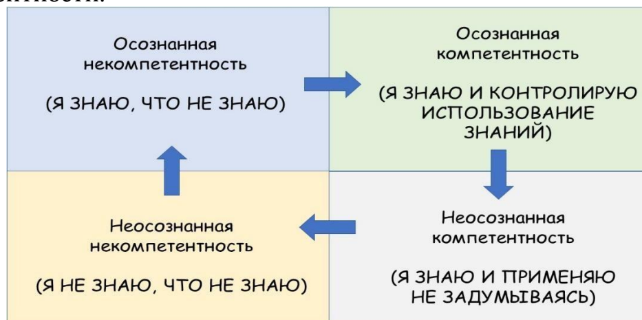
Рис. 2. Переход от бессознательной некомпетентности к бессознательной компетентности

Этот четырехступенчатый процесс представляет собой переход от бессознательной некомпетентности к бессознательной компетентности.