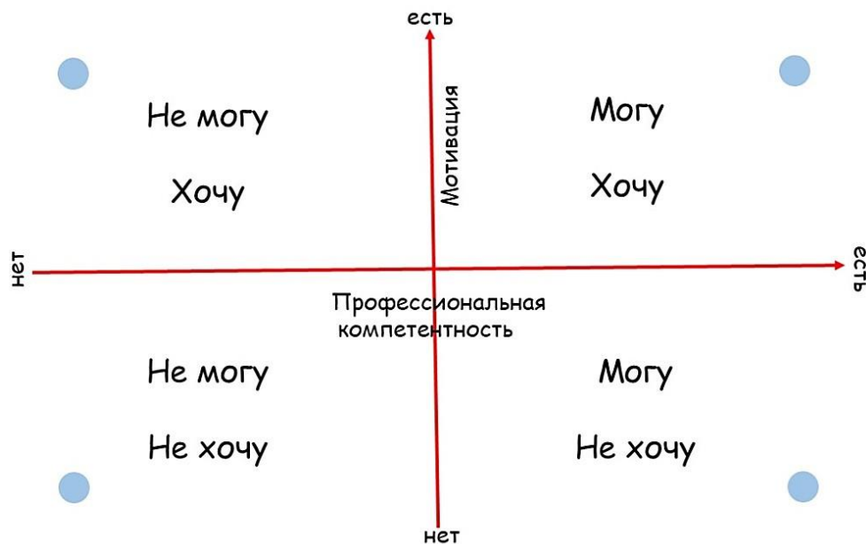
Рис. 1. Готовность молодого специалиста к работе (на основе модели ситуационного руководства Херси-Бланшара)

«Могу, хочу», то есть при имеющемся желании предоставить ему и возможности для продуктивной деятельности.